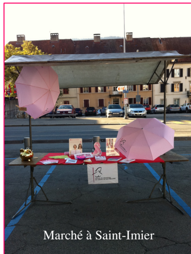
Marché à Saint-Imier