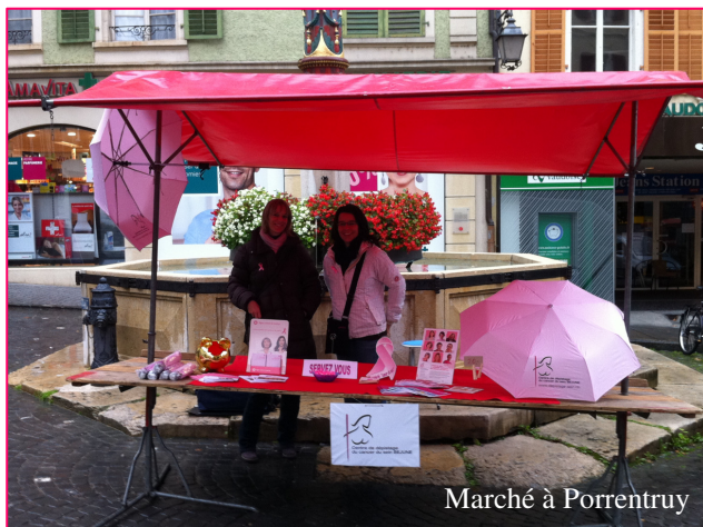
Marché à Porrentruy